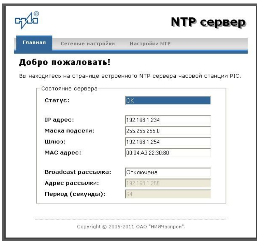
Рис.2 – Главная страница web-интерфеса

Окно браузера отобразит главную страницу web-интерфейса как показано на рисунке 2. В верхней правой части страницы расположено меню навигации, которое содержит три пункта-ссылки на основные страницы: «Главная», «Сетевые настройки» и «Настройки NTP».